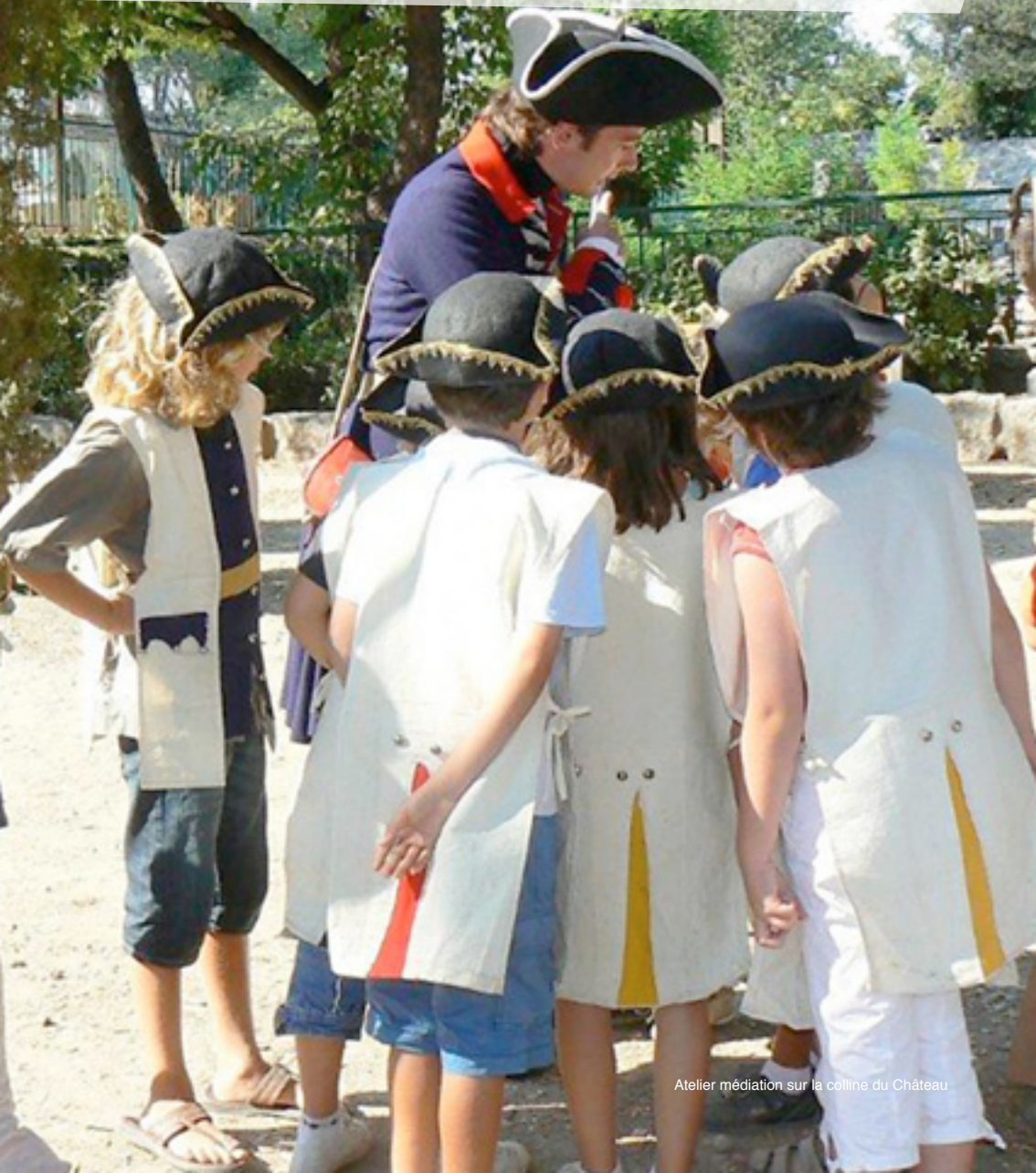
Atelier médiation sur la colline du Château