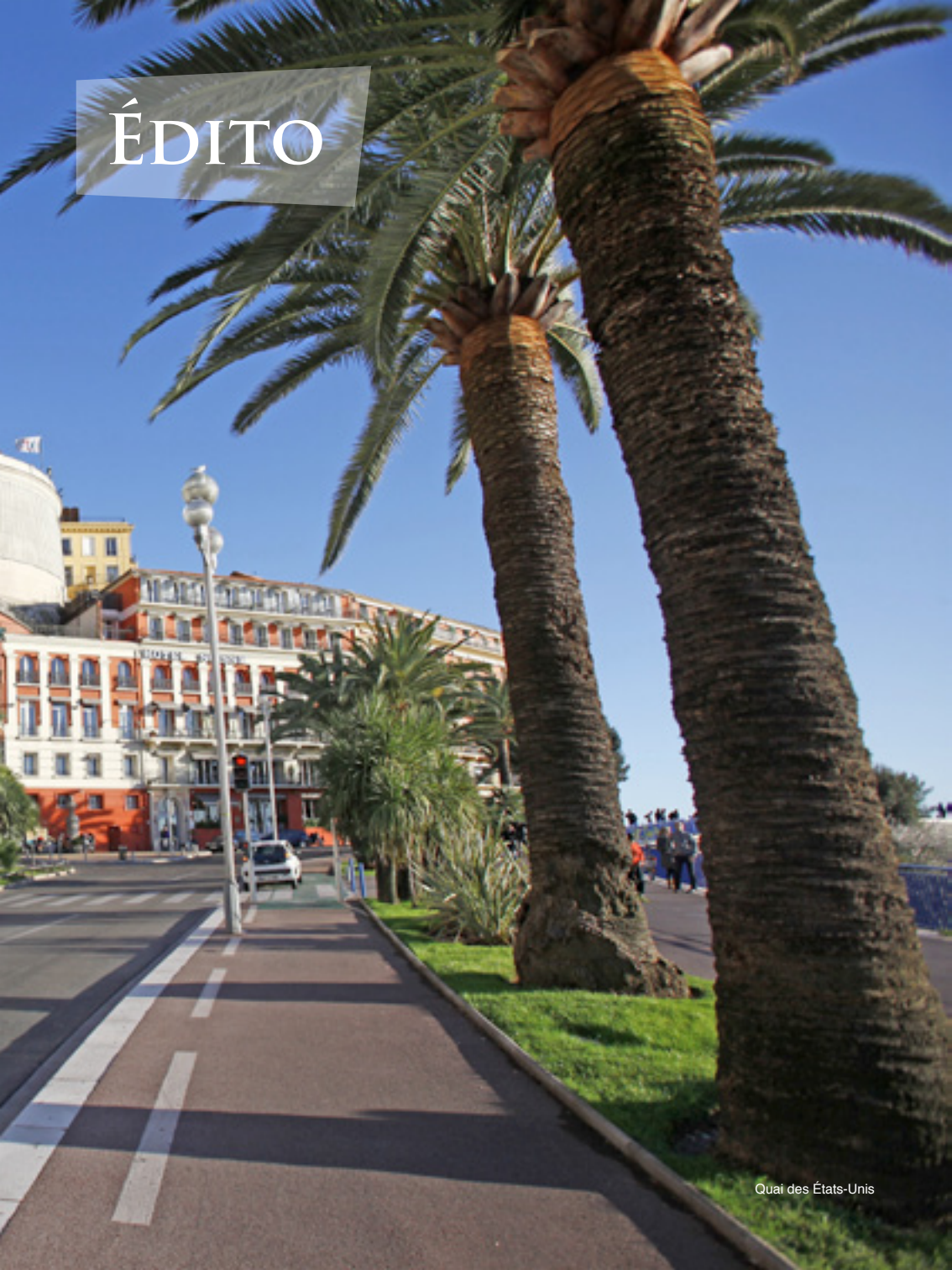
Quai des États-Unis